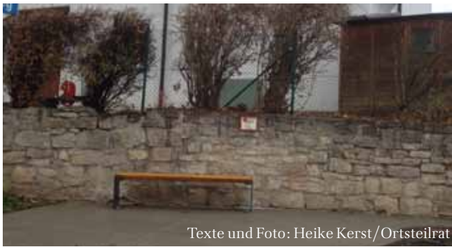
Texte und Foto: Heike Kerst/Ortsteilrat

Am Samstag, den 11.11.2017 wurde vom Ortsteilrat kurzerhand veranlasst, eine von den zwei angeschafften Bänken einfach und ohne Bürokratie aufstellen zu lassen. Danke an T. Steinbrück und T. Stange (BTS GmbH). Vielleicht sollten wir auch die zweite einfach so aufstellen... Erkennen Sie, wo sie steht? Genießen Sie den Ausblick.