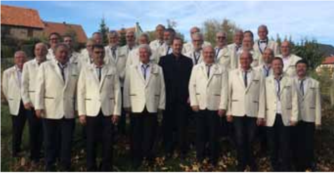
Der Männerchor nach einem Auftritt zur 800-Jahr-Feier im schönen Ort Meckfeld - hier ein Schnappschuss beim fröhlichen Singen in freier Natur beim gemeinsamen Ausflug nach dem Konzert.

...übrigens sangesfreudige Männer, die gerne die schöne Tradition des Singens im Männerchor hier in Tiefthal mit weiterführen möchten, sind jederzeit gern willkommen! Wie man hier sehen kann, wird nicht immer nur fleißig ge- probt, es gibt auch interessante abwechslungsreiche Veranstaltungen in regelmäßigen Abständen, die den Zusammenhalt im Verein und im Ort fördern und voll Freude von allen Sängern und deren Familien angenommen werden.