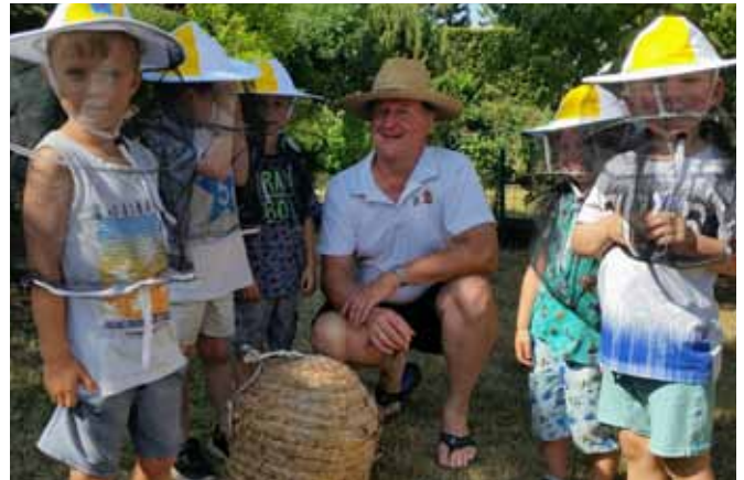
Text und Fotos: Kerstin Sauer/Kita „Tiefthaler Strolche“

hatten noch lange was zum Lecken. Eine Frage bereitete uns aber Kopfzerbrechen, als wir wieder im Kindergarten waren. Wenn die Bienen immer weniger werden, weil sie keine Blumen und somit Nahrung mehr finden, wie können wir ihnen denn helfen? „Na wir können doch Blumen sähen und pflanzen in unserem Garten.“ Ja, das werden wir machen. Oder eine Wildblumenecke im Kindergarten anlegen. Vielleicht haben Sie ja auch Ideen, was Sie in Ihrem Umfeld tun können, um den Bienen zu helfen, Nahrung zu finden... Recht vielen Dank an Frank Wellner für dieses interessante Erlebnis.