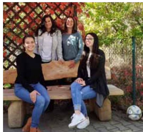
Die Erzieher unserer Tiefthaler KiTa, eine Erzieherin fehlt im Bild.