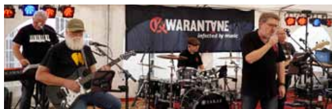
die Band Kwarantäne