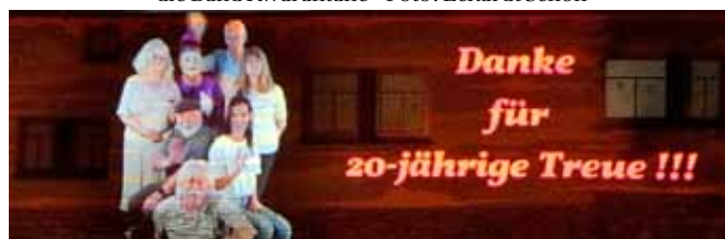
Video-Performance - Foto: Eckardt Schön