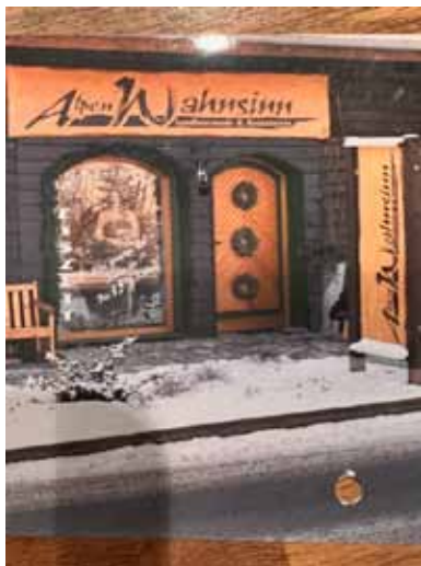
Der Tiefthaler Standort kurz nach der Gründung im Jahre 2002.

Werte Tiefthaler Kundschaft, liebe Tiefthaler,