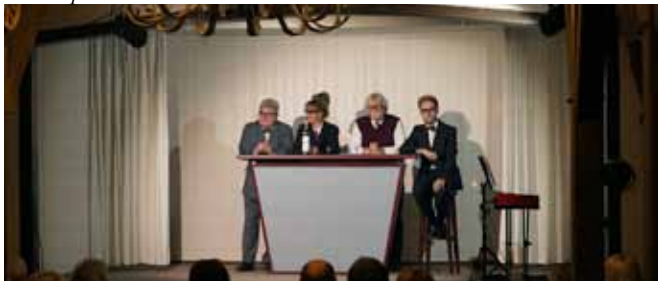
Kabarett Arche