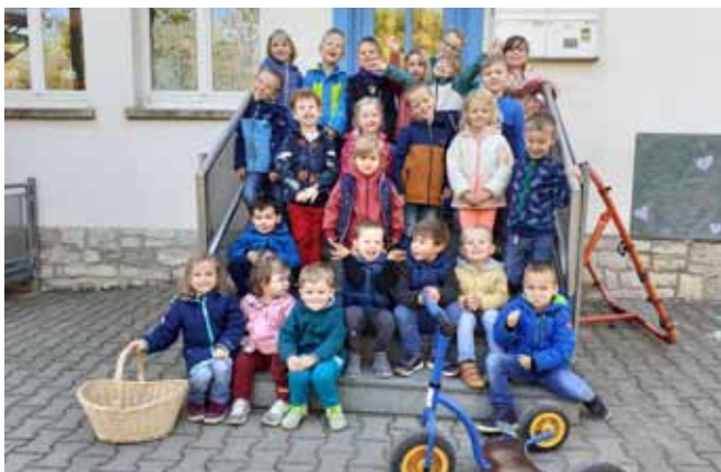
Die Kinderschar der „Tiefthaler Strolche“ - große und kleine Gruppe.

Fotos: Frau Grüttner/Frau Sauer, Text: Anne Denner/Christel Diegel