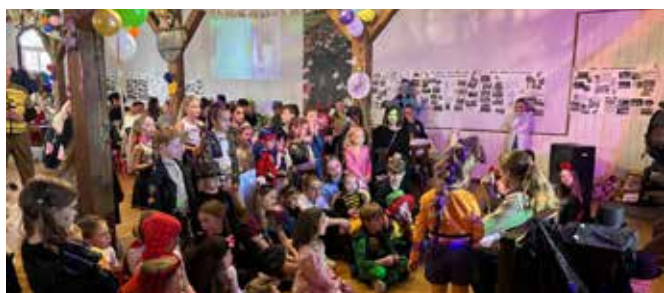
Der Saal ist voll - die Kleinen voll im Zauber-Faschings-Fieber.