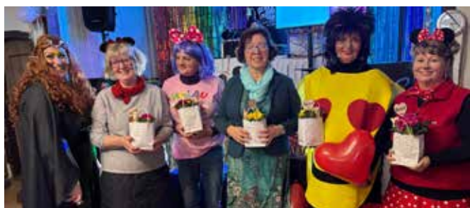
Einige Gründungsmitglieder und - ehemalige - Vorsitzende