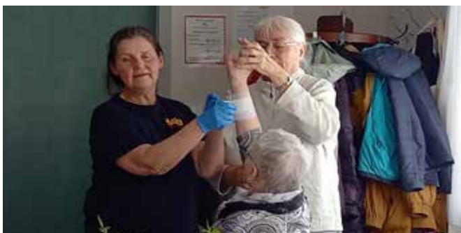
Text und Fotos: Constanze Wagner