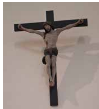
Text: Hellmut Fröhlich

Es wurden dafür Naturfarben, u.a. aus Schlämmkreide und für die Leidenszeichen Rinderblut verwendet. Bei jedem Kirchengang freue ich mich, wenn ich unter „meinem Sühnekreuz“ in mich gehen kann und darüber, dass die Kirche in Tiefthal ein lebendiges Kulturdenkmal ist.