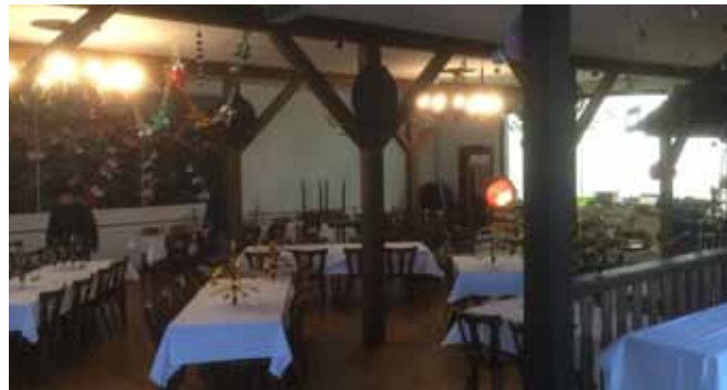
Der Saal - hier wurde er gerade für Silvester hergerichtet.

Inwieweit erfolgt schon jetzt aufgrund des Wegfalls der Festhalle eine Nutzung durch die Vereine – oder anders gefragt: Wie sieht es mit der Auslastung aus?