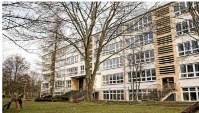
Die Grundschule 20 in Gispersleben