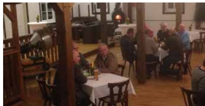
Die Veranstaltung fand auf dem Saal in Tiefthal statt.